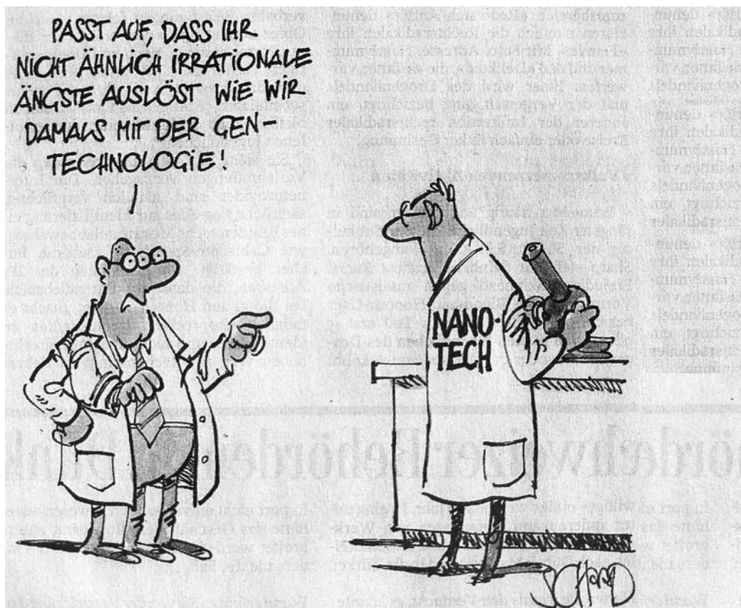
Tages-Anzeiger, 23 janvier 2009. Caricature de Felix Schaad

Les denrées alimentaires ne devraient contenir aucun élément pouvant nuire à l'organisme. Et certains doutes se justifient, puisque l'on sait aujourd'hui qu'une même matière se comporte souvent différemment sous forme de nanoparticules que sous forme macroscopique. C'est pourquoi une recherche sur les risques de ce type d'utilisation est particulièrement importante, notamment, comme le recommande l'étude, en examinant les conséquences tout au long du cycle de vie d'un produit, de son élaboration à sa destruction. Le principe de précaution doit s'appliquer: toute pollution ou atteinte à la santé et à l'environnement doivent être évitées. (sbr)